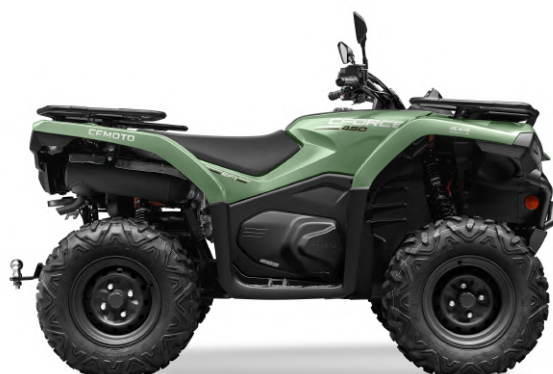
Version CFORCE 450 Luxe